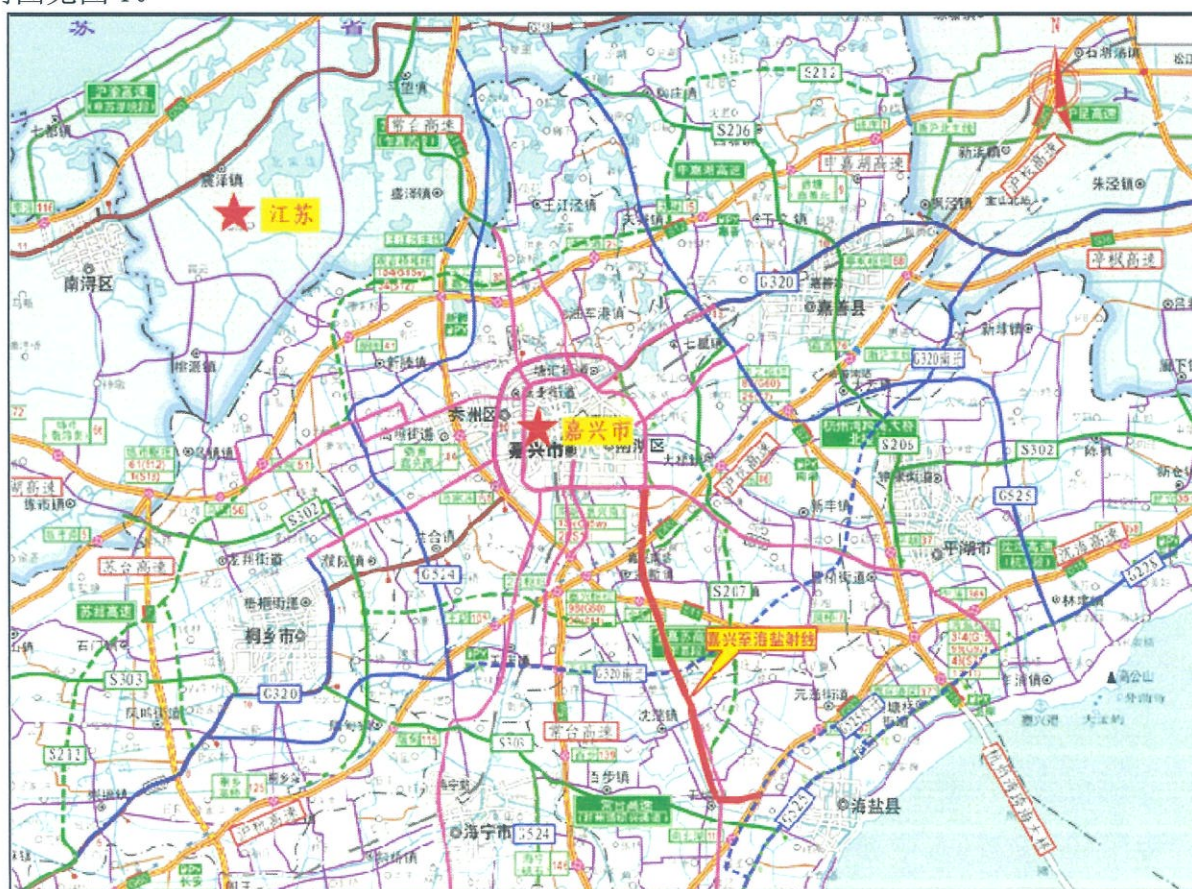
图1 项目线路走向图

主要生态环境保护目标为道路用地及周边区域的植被、生境、水土等生态环境。具体线路走向见图1。